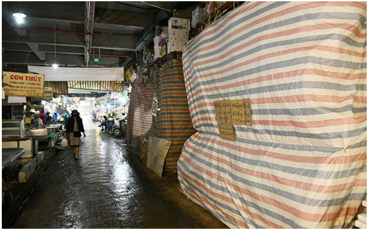
(Anh minh hoa: DUY LINH)

Trng i hc Kinh t quc dân (HKTQD) va công b Báo cáo "ánh giá tác ng ca dch Covid-19 n nn kinh t và các khuy n gh chính sách" (sau ây gi tt là Báo cáo) ngay 3-4. ây là nghi n cu chuyên sâu ca 50 nhà khoa hc xut sc c Trng HKTQD quy t, gi n Chính ph, góp sc cho cuc chin chng dch bnh Covid-19.